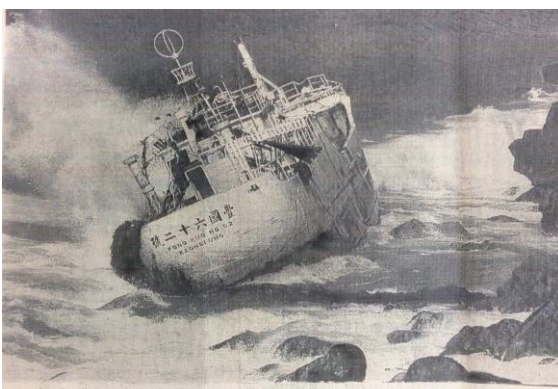
Les plongeurs de la commission archéo oeuvrent actuellement afin de géo localiser ce navire.

Sources : Le Journal de l'île de La Réunion , samedi 7 juillet 1973, 23 ème année, numéro 7346. Photo de M. Alain Diaz.