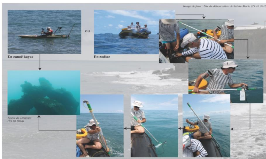
Protocole d'enregistrement des vestiges à l'aide d'un système vidéo

Le protocole d'enregistrement des vestiges à l'aide d'un système vidéo expérimenté durant la campagne archéologique 2016 a été concluant. Son application sera désormais systématique pour nos futures campagnes.