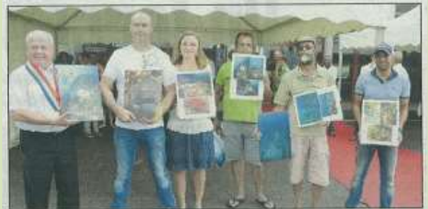
La remise des prix du concours photo hier à Sainte-Rose.